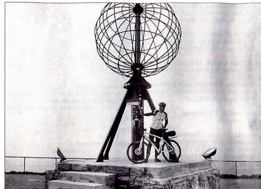
Das Ziel erreicht. Mit der Deutschlandfahne auf dem Nordkap. Der 50-jährige Mutlanger Gerd Hinderberger fuhr insgesamt 2950 Kilometer mit dem Rad.

(180 km): Über Nacht hatte es sehr stark geregnet und gestürmt. Nach 20 km ist der Mutlanger ins Auto umgestiegen. Auf dem Fahrrad waren die nächsten 160 km mit ziemlich viel Gegenwind versehen.