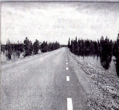
Lange, einsame Straßen, aber eine beeindruckende Natur.

Radsport, Tour zum Nordkap: Gerd Hinderberger aus Mutlangen radelt in vier Wochen 2950 Kilometer